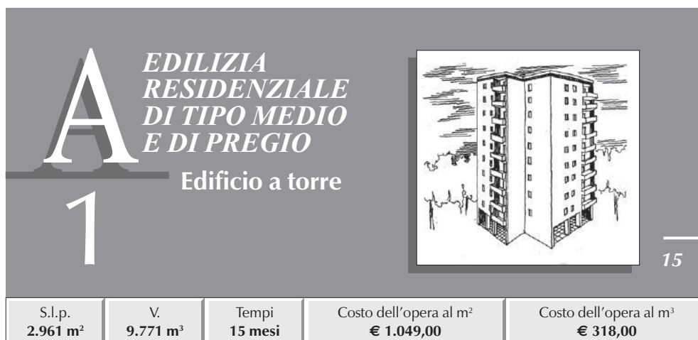
TABELLA RIASSUNTIVA DEI COSTI E PERCENTUALI D'INCIDENZA