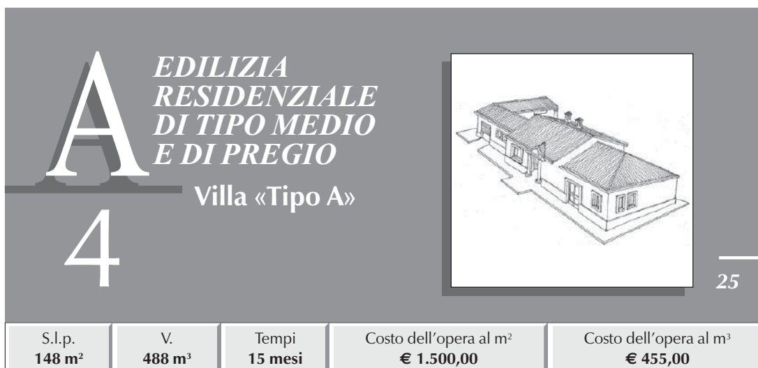
TABELLA RIASSUNTIVA DEI COSTI E PERCENTUALI D'INCIDENZA