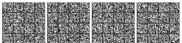
Tabella V.5- 3: Livello di prestazione per controllo dell'incendio